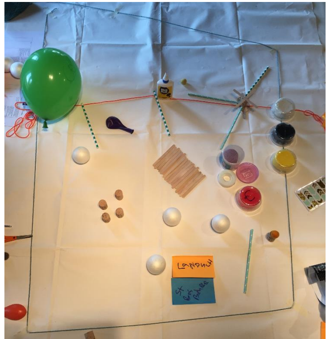
Afbeelding 1: Huidig systeem (groep 1)