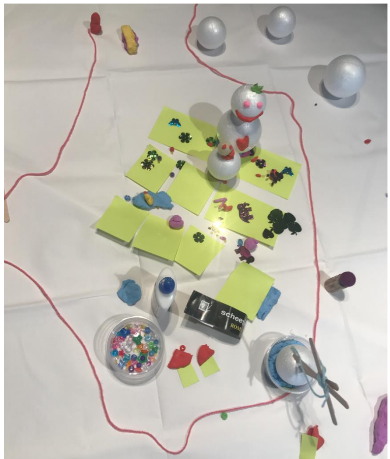
Afbeelding 4: Toekomstig systeem (groep 2)