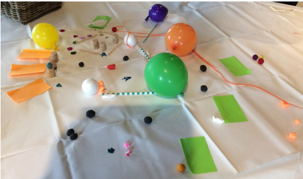
Afbeelding 5: Huidig systeem (groep 3)