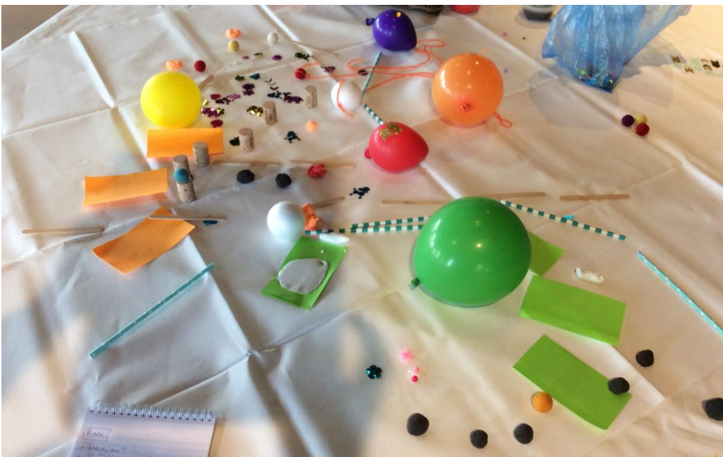
Afbeelding 6: Toekomstig systeem (groep 3)